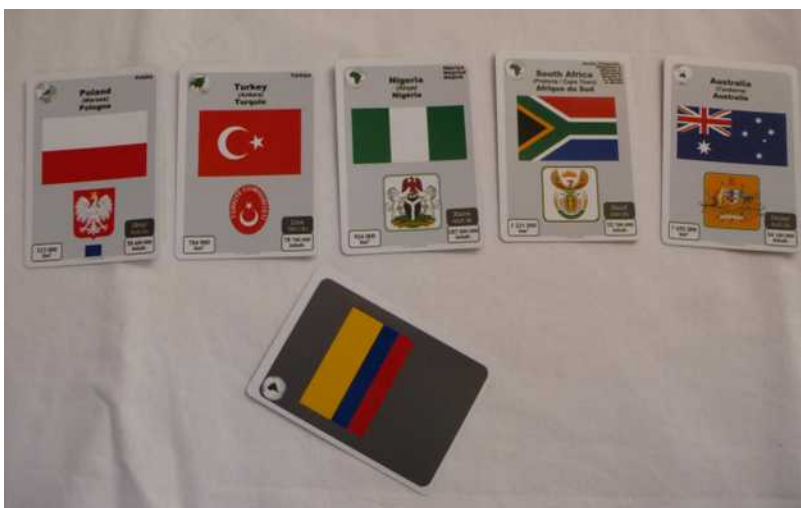
Partie en action : quel est ce pays avec le drapeau jaune-bleu-rouge ?

À chacun leur tour, les joueurs continuent d'insérer leurs cartes unes à unes, soit dans la ligne horizontale des superficies, soit dans la ligne verticale des populations, selon le même mode : placer, nommer, puis retourner et appliquer les actions du tableau.