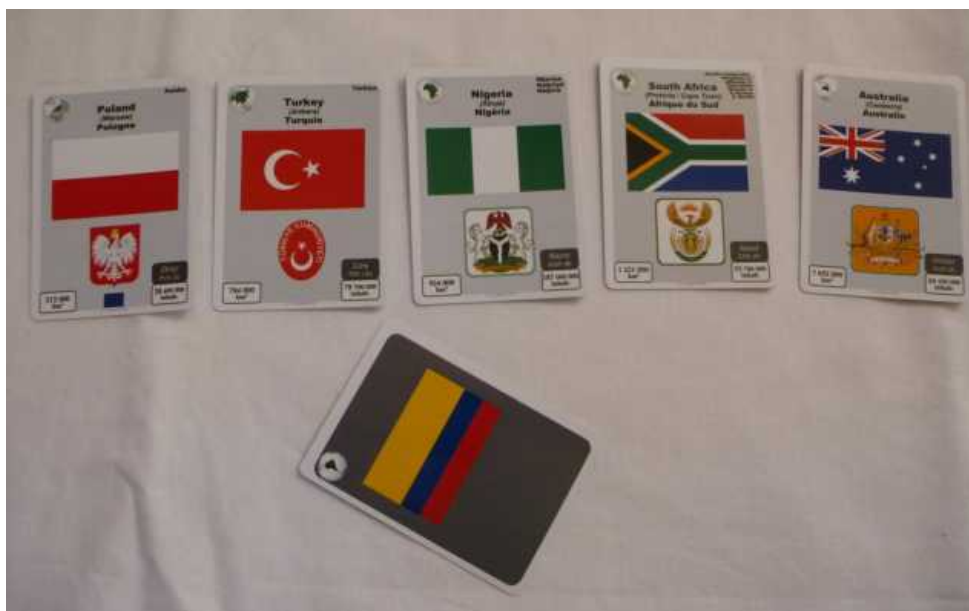
Partie en action : quel est ce pays avec le drapeau jaune-bleu-rouge ? Où le placer dans la ligne en fonction de sa superficie ?

Au fil du jeu, les cartes forment donc une ligne classée en ordre croissant selon la superficie ou la population, dans laquelle les joueurs viennent successivement placer leurs cartes unes à unes.